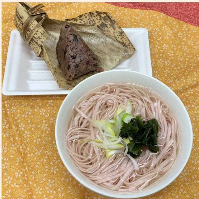
桜うどんと古代米ちまき