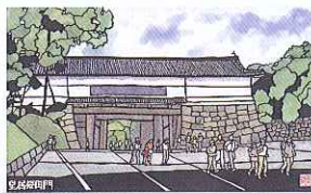
③ 原田重穂「切絵 皇居桜田門」