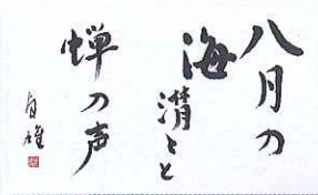
⑩ 鈴木貞雄「八月の海」