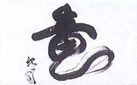
⑧ 谷村新司「海(あま)の竜」