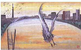
② 鈴木義明「暮れなむ都鳥」