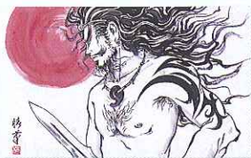
① ツバキアンナ「荒魂」

毎年「みたままつり」には御祭神奉慰の意を以て各界有名人の方々に書、絵画の揮毫をお願いし、社頭に掲げています。そのうちから十葉を選び揮毫選集(四十九輯)として皆様にお頒ちしています。